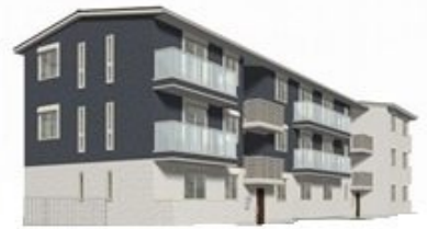
完成予想図のため、実際とは異なる場合があります

24時間緊急通報システム,オートロック,カードキー,セキュリティ有り,通風良好,防犯ガラス,陽当たり良好,防犯カメラ